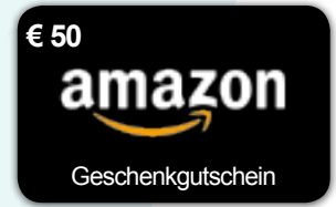
Amazon-Gutschein im Wert von 50 €

* Zur Verrechnung mit Leistungen der azh.