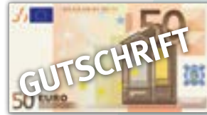
Gutschrift über 50 € *